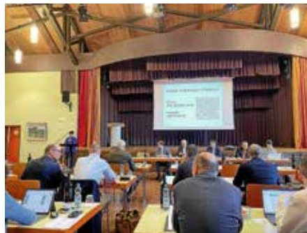
Kreisverbandsversammlung in Beilstein

des viermaligen Hector-Kurses im Sitzungssaal des Rathauses. Was passiert im Rathaus? Wo sitzt die Bürgermeisterin am Ratstisch? Welche Parteien sind im Gemeinderat? Was entscheidet dieser? Für die Schülerinnen und Schüler selbst war es spannend zu sehen, was eine Kommune für die Bürger macht. Das beginnt schon bei der Morgentoilette im Bad. Wie kommt sauberes Wasser ins Haus? Und Strom für den Fön? Dass das Abwasser zur Kläranlage geht, wussten die Kinder aus Lauffen und der Region bereits. Aber auch Busverkehr, Kindergärten und Schulen, Freibad und Spielplätze oder Straßen würde es ohne die Kommune nicht geben. Dann ging es auf Tour durchs Rathaus, wo Kämmerer, Hauptamt, Trauzimmer und das Büro der Bürgermeisterin besichtigt wurden. Klar, dass alle auf dem Bürostuhl im Bürgermeister-Büro Probe sitzen wollten. In den nächsten Wochen folgen Bauamt mit Begutachtung der Kinderzimmer in den Bauanträgen, Bürgerbüro, Ideen für die kommunale Arbeit als Brief ans Rathaus sowie gemeinsame Spiele.