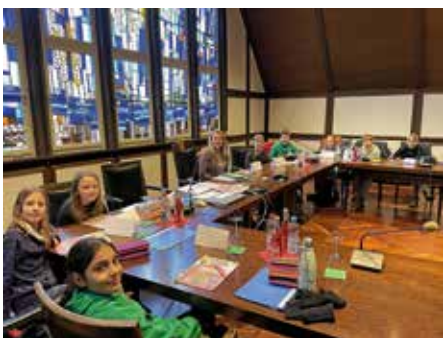
Die Kinder des Hector-Kurses im großen Sitzungssaal