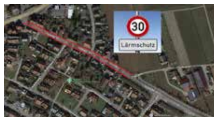
Tempo 30 km/h in der Ilsfelder Straße

Die Auswertungen des fortzuschreibenden Lärmaktionsplan der Stadt Lauffen a.N. hatten ergeben, dass in bestimmten Bereichen von Lauffen a.N. der Lärm durch die Anordnung von Tempo 30 entsprechend reduziert werden kann.