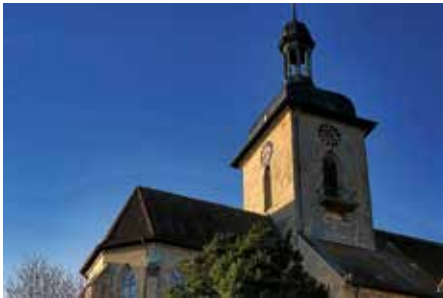
Foto: Günther Schiffel aus dem Wettbewerb zum Foto des Jahres 2023: Regiswindiskirche im Sonnenaufgang

Hoch oben über dem Neckar thront diese imposante Kirche, ein Wahrzeichen der Stadt Lauffen mit schillernder Geschichte. Die Anfänge der Kirche liegen fast 1200 Jahre zurück. Die „Lauffener Sonntagsführung“ mit Gästeführer Gerhard Kuppler, Pfarrer i.R., erzählt Fakten, Daten und Geschichten rund um diesen bemerkenswerten Sakralbau. Nicht immer war die Regiswindiskirche in dieser Größe