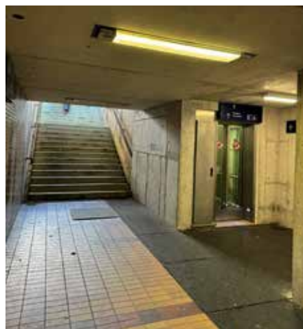
Im Zuge der Neugestaltung werden auch die schadhafte Bodenbeläge der Bahnunterführung saniert

Einschränkungen durch halbseitige Sperrung