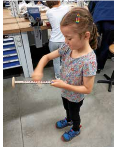
Eine spaßige Springraupe wurde angefertigt und ebenfalls in das Nachhausegeschenk mit eingepackt

Und zum Abschluss durften alle noch eine spaßige Springraupe, natürlich auch selbst gemacht, in das Nachhausegeschenk der Firma Schunk einpacken. Glücklicherweise und stolz über die handwerklichen Leistungen marschierten wir zurück in die Einrichtung.