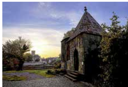
Foto: Ulrich Seidel – Regiswindiskapelle – aus dem Wettbewerb zum Foto des Jahres 2023

Diese öffentliche Führung zeigt den Gästen Orte und schildert Ereignisse, die eng mit den Personen Hölderlin und Regiswindis verbunden sind. Friedrich Hölderlin: Der berühmte, 1770 in Lauffen geborene Dichter und Philosoph. Das siebenjährige Mädchen Regiswindis: Nach dem gewaltsamen Tod im Jahre 839 stieg