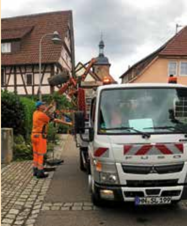
Schachtreinigung aktuelles Bild 2019

Mitarbeiter des Bauhofs sind derzeit damit beschäftigt, die Schächte im Stadtgebiet sowie die Rinnen zu reinigen.