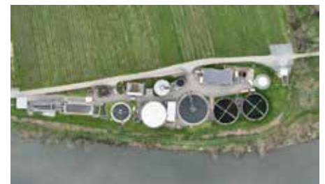
Luftbild der Lauffener Kläranlage

Aktion Kläranlage – Vom Abwasser zum Frischwasser – eine Führung durch die Lauffener Kläranlage