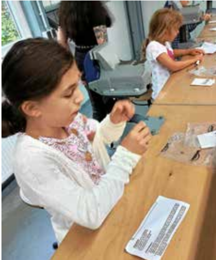
Ein Tic-Tac-Toe Spiel aus Holz sollte angefertigt werden

Ein Ausflug zum Ausbildungszentrum der Firma Schunk lohnte sich auch dieses Jahr. Wir wurden herzlich empfangen vom Ausbildungsleiter und den jungen Auszubildenden.