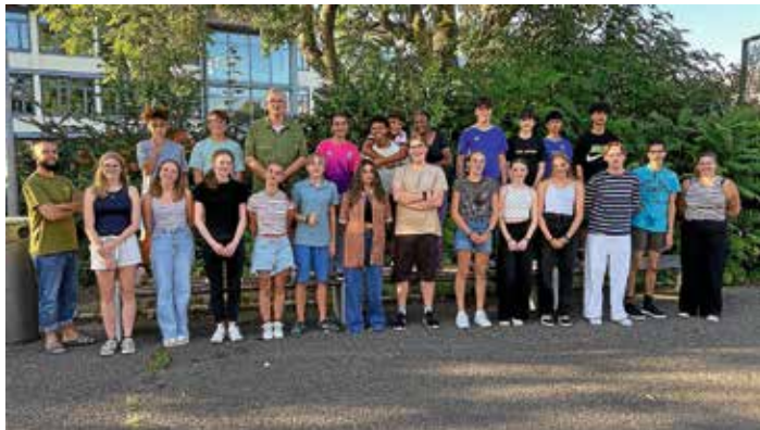
24 junge Menschen aus Lauffen a.N. und La Ferté-Bernard sind für das erste deutsch-französische Sport- und Freizeitcamp eingetroffen

das persönliche Gespräch mit Ihnen, liebe MitbürgerInnen, ist mir sehr wichtig. Ich möchte wissen, was Sie bewegt und wo der Schuh drückt. Außerdem Ihre Anregungen, Vorschläge, Ideen, aber auch Ihre sachliche Kritik in unsere kommunalpolitische Arbeit miteinfließen lassen und die Schwerpunkte unserer Arbeit im Gemeinderat und im Rathaus mit Ihnen gemeinsam entwickeln. Nehmen Sie daher sehr gerne Kontakt mit mir auf – schriftlich, per Mail oder Videocall, telefonisch oder vereinbaren Sie einen persönlichen Termin in meiner regelmäßigen Bürgersprechstunde unter Tel. 07133/10610 oder kasti@lauffen-a-n.de . Die nächste Bürgersprechstunde findet am Montag, 2. September von 16 bis 18 Uhr statt.