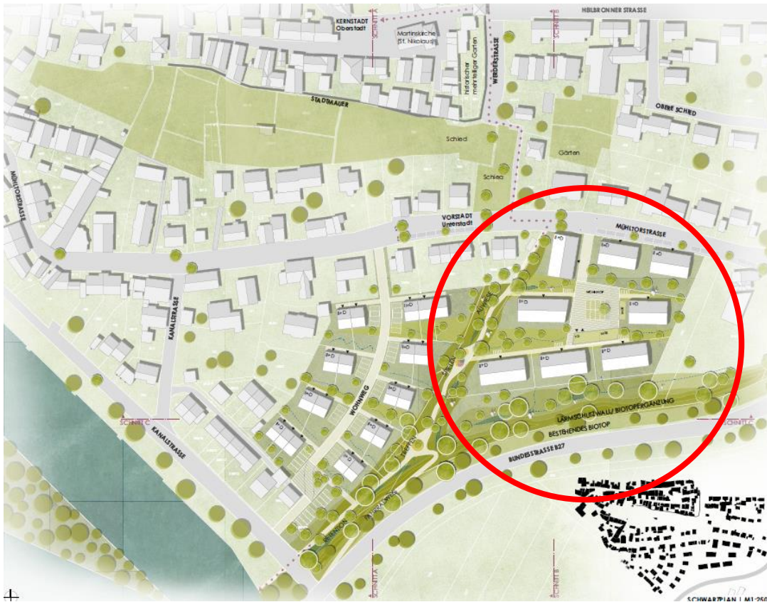
Wettbewerb Zoll Architekten Stadtplaner, 2021