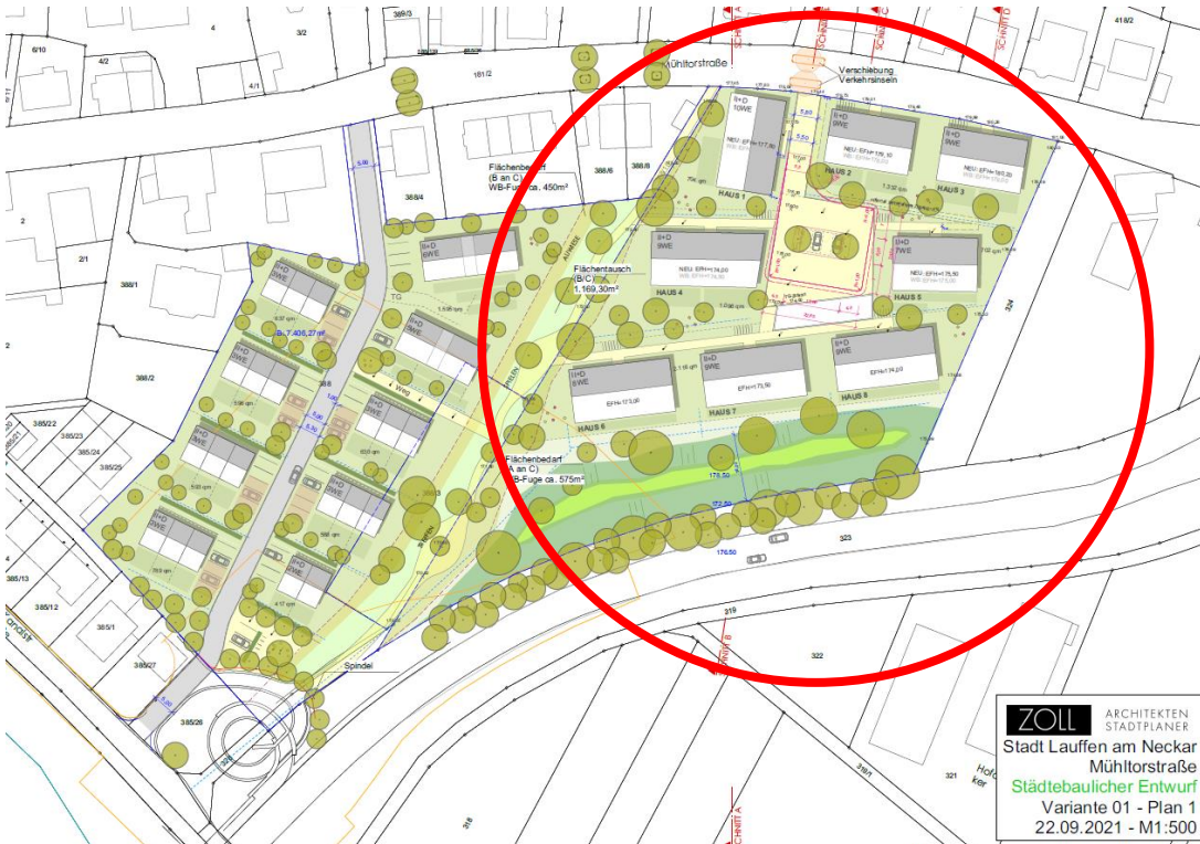
Städtebaulicher Entwurf Zoll Architekten Stadtplaner, 2021